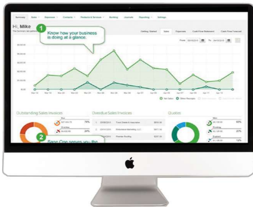
داشبورد - Sage